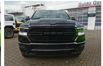
Autohaus Guido Gemein GmbH in Krefeld