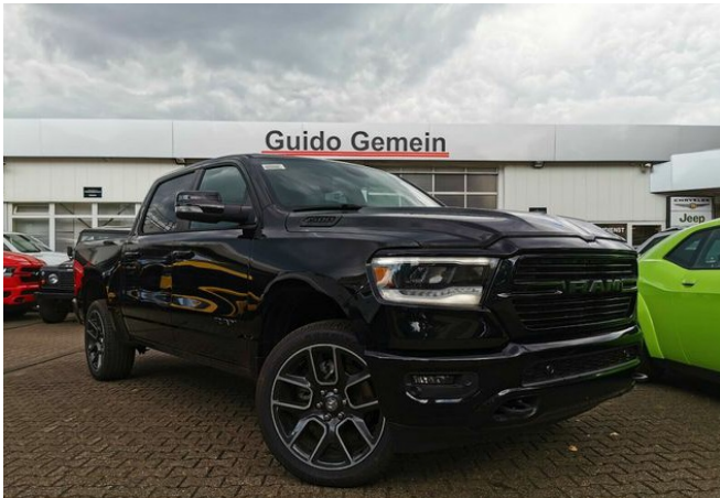
Autohaus Guido Gemein GmbH in Krefeld