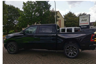
Autohaus Guido Gemein GmbH in Krefeld