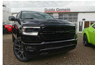
Autohaus Guido Gemein GmbH in Krefeld