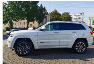
Autohaus Guido Gemein GmbH in Krefeld