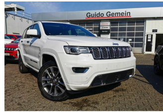
Autohaus Guido Gemein GmbH in Krefeld