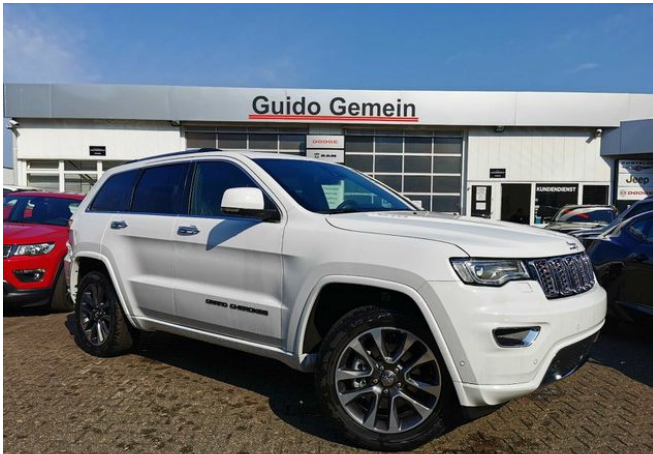
Autohaus Guido Gemein GmbH in Krefeld