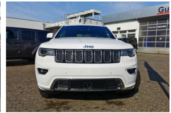
Autohaus Guido Gemein GmbH in Krefeld