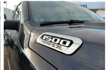
Autohaus Guido Gemein GmbH in Krefeld