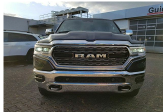
Autohaus Guido Gemein GmbH in Krefeld