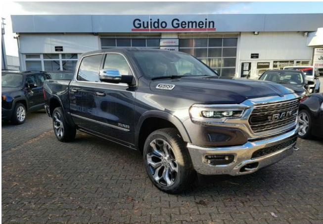
Autohaus Guido Gemein GmbH in Krefeld