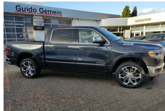
Autohaus Guido Gemein GmbH in Krefeld