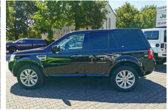
Autohaus Guido Gemein GmbH in Krefeld