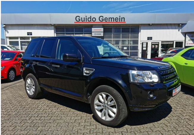
Autohaus Guido Gemein GmbH in Krefeld