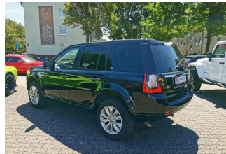
Autohaus Guido Gemein GmbH in Krefeld