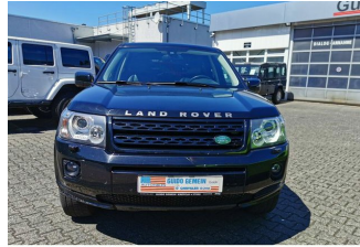
Autohaus Guido Gemein GmbH in Krefeld