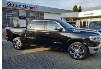
Autohaus Guido Gemein GmbH in Krefeld