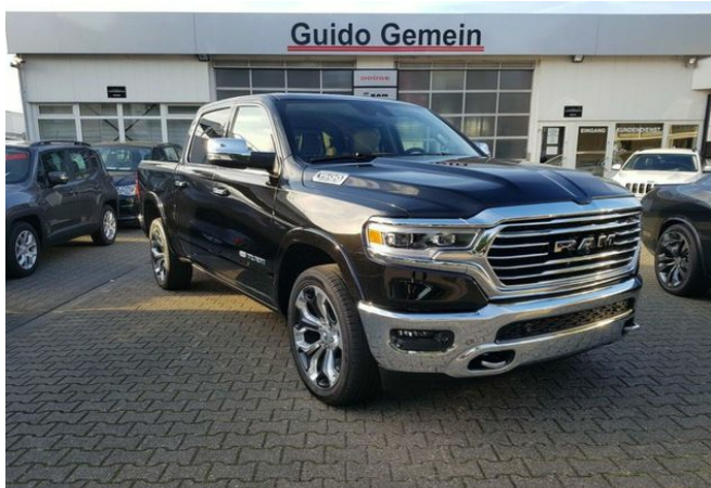
Autohaus Guido Gemein GmbH in Krefeld