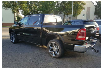
Autohaus Guido Gemein GmbH in Krefeld