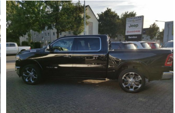
Autohaus Guido Gemein GmbH in Krefeld